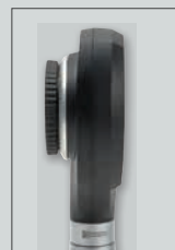
sin disco de contacto

Cabezal de dermatoscopio NC 1 sin disco de contacto, cabezal de otoscopio LED F.O. mini3000, 2 mangos baterías mini3000 (con pilas), con 5 espéculos desechables de 2,5 e 4 mm Ø, estuche de cremallera [02] D-891.11.021