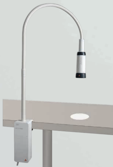
Lámpara de exploración EL10 LED con fijación por mordaza