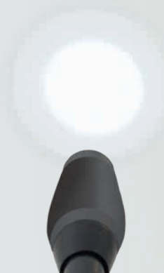
Este es un LED convencional

El cabezal iluminador compacto (aprox. 60 mm) permite una iluminación casi coaxial, especialmente en situaciones de uso difíciles.