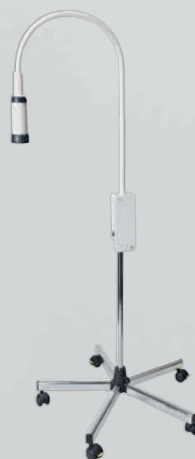
Lámpara de exploración EL10 LED con trípode sobre ruedas de metal