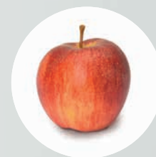
LED HQ : El rojo es rojo