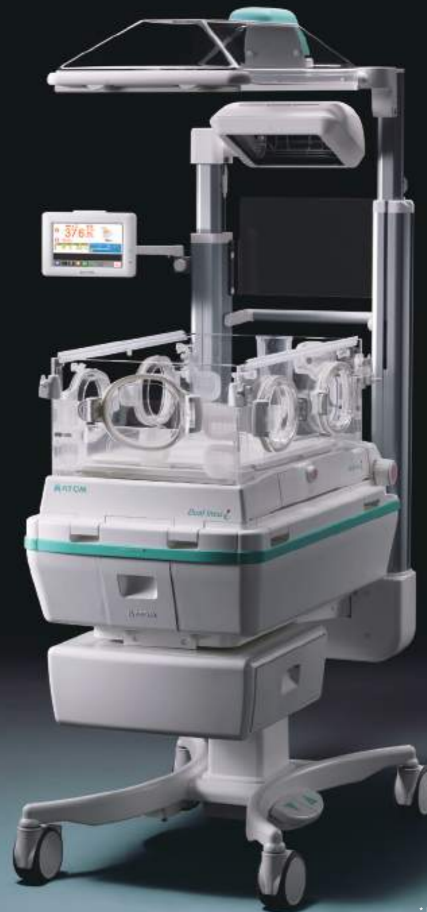
Modo incubadora neonatal