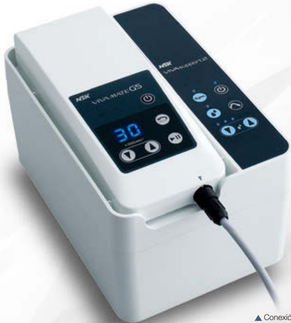
▲ Conexión a VIVAMATE G5 (VIVAMATE G5 opcional)

VIVAsupport 2 es un sistema de irrigación y de eyección de saliva desarrollado en base a un concepto nuevo: la búsqueda de "portabilidad" y "flexibilidad", indispensables para la odontología móvil. Esta unidad de control, ligera, compacta y equipada con funciones elementales, se guarda en un maletín de transporte liviano y resistente. Al combinar VIVAsupport 2 con el escarificador ultrasónico compacto Varios 370, los odontólogos pueden trasladarse para ofrecer no solo sesiones de tratamiento, sino también de mantenimiento. VIVAsupport 2 constituye la última generación de sistemas de odontología móvil que permite ofrecer todo tipo de servicios, desde ajuste de dentaduras a tratamientos integrales.