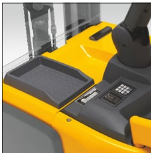
Bandeja de la ERC