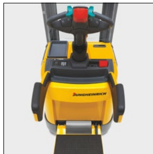
Puesto de mando de la ERC