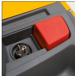
Manipulación fácil del enchufe de red del cargador integrado