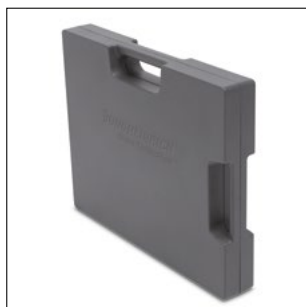
Maleta de la batería 40 Ah