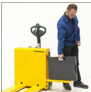
Cambio de batería por el lateral